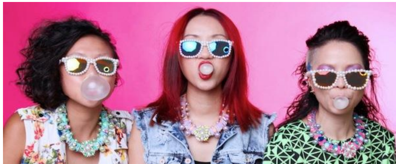
แนวโน้มการออกแบบเครื่องประดับเป็นไปตามแฟชั่นมากขึ้น และเน้นกลุ่มอายุน้อยลง

สำหรับตลาดเครื่องประดับฮ่องกง ปัจจุบันจะมีการเน้นการดีไซน์ให้เป็นไปตามแฟชั่นมากขึ้น โดยดีไซน์ที่มีไอเดียหรือนวัตกรรมใหม่ ก็จะช่วยยกระดับสินค้าสู่ตลาดบนได้ นอกจากนี้ ผู้ผลิตเครื่องประดับหันมาให้ความสนใจกับกระแสแฟชั่นมากขึ้น เน้นกลุ่มเป้าหมายอายุน้อยลง และมีรายได้ระดับปานกลาง รวมทั้งมีการสร้างแบรนด์มากขึ้น นอกจากนี้ แนวโน้มที่ผู้ซื้อรายใหญ่จะเข้ามาแทนรายย่อยมากขึ้น โดยเฉพาะในตลาดสหรัฐอเมริกา ซึ่งในช่วง 10 ปีที่มีผู้ประกอบการรายย่อยลดจำนวนลงไปอย่างมาก เนื่องจากไม่สามารถแข่งกับห้างใหญ่ อาทิ Wal-mart (ส่วนแบ่งตลาดร้อยละ 20) , Target, Costco โดยผู้ประกอบการรายใหญ่เหล่านี้มีอำนาจต่อรองสูง ทำให้ผู้ประกอบการฮ่องกงถูกกดดันด้านราคาและต้องให้บริการเสริมอื่นๆ เพิ่มเติมเพื่อจะแข่งขันได้