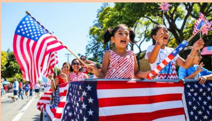
เมืองต่างๆ ทั่วประเทศ มักมีการจัดงานเดินขบวนเฉลิมฉลองวัน July 4th