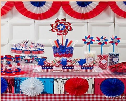
ชาวอเมริกันมักตกแต่งงานเลี้ยง July 4th ด้วยของตกแต่งที่มีความหมายสื่อถึงธงชาติสหรัฐฯ