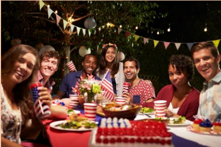
ชาวอเมริกันนิยมรับประทานอาหารร่วมกันในวัน July 4th