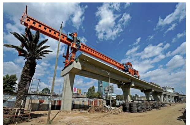
ภาพ : ตัวอย่าง การพัฒนาโครงสร้างพื้นฐานในเอธิโอเปีย เช่น ระบบราง รถไฟฟ้า ถนนต่างๆ ที่อยู่ระหว่างการก่อสร้างและเปิดใช้งานแล้วในกรุง Addis Ababa ของเอธิโอเปีย