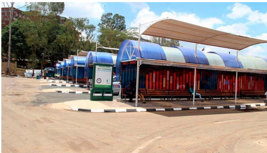
ภาพ : สถานี Green Park Bus Terminus กำหนดเริ่มเปิดใช้งานในเดือนมิถุนายน 2565

เป็นสถานที่ขนส่งรถสาธารณะแบบมีอาคารถาวรแห่งแรกในเคนยา ที่จะเป็นศูนย์กลางการขนส่งโดยเฉพาะรถโดยสารต่างๆ ตลอดจนมีแผนจะพัฒนาเชื่อมโยงกับระบบขนส่งสาธารณะที่จะมีในอนาคต เช่น rapid transport (BRT) รถบรรทุกในการกระจายสินค้า ซึ่งโครงการดังกล่าวมุ่งหวังจะลดการแออัดของการจราจรในกรุงไนโรบี