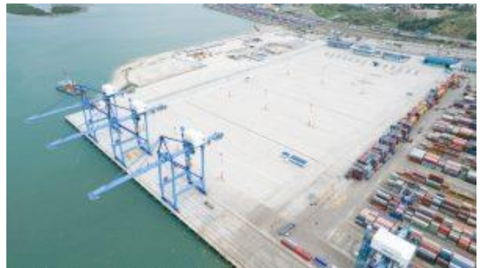
ภาพ การขยายท่าเรือ Mombasa ที่พร้อมเปิดใช้งานแล้วในปัจจุบัน