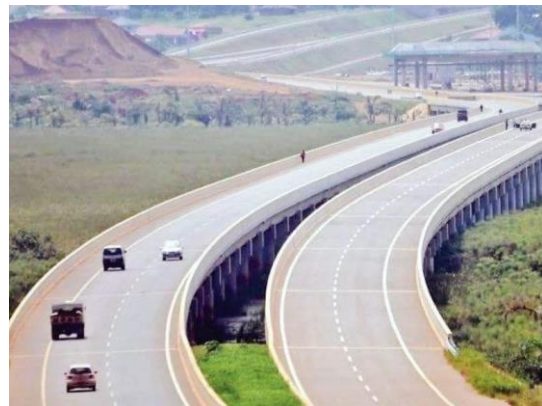
ทางด่วนเชื่อมระหว่างกรุง Kampala สนามบิน Entebbe ที่เปิดให้บริการแล้ว