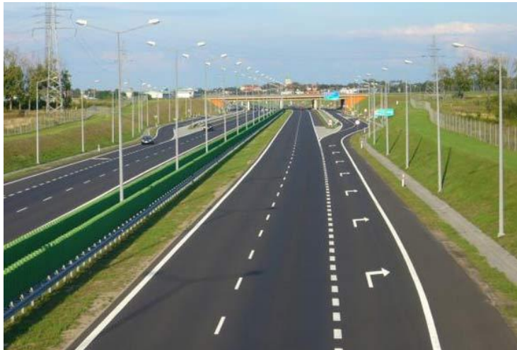
ภาพ : ทางด่วนเส้นทาง Kampala-Jinja Expressway ที่อยู่ระหว่างการก่อสร้าง

เป็นทางด่วนระยะทาง 108 กม. ที่เชื่อมโยงระหว่างเมือง Kampala เมืองหลวงและศูนย์กลางธุรกิจของยูกันดา และ Jinja ที่เป็นเมืองรองที่จะเชื่อมต่อกับเส้นทางคมนาคมของประเทศอื่นในแอฟริกาตะวันออก สาย Northern Corridor เช่น เคนยา DRC ตองเหนื่อและตะวันออก ชูดานใต้และเอธิโอเปีย