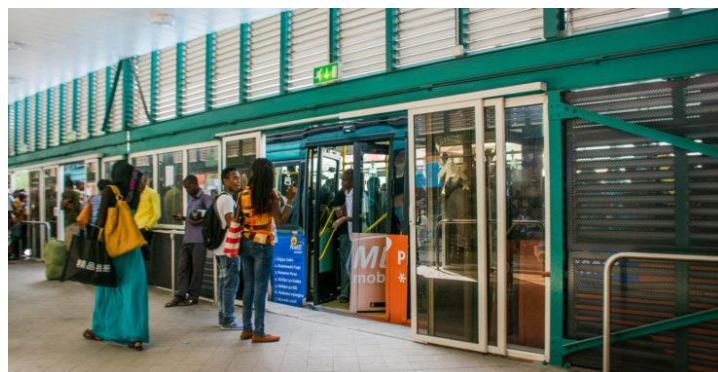
ภาพ: โครงการรถเมล์ด่วน Dar es Salaam Bus Rapid Transit (BRT)