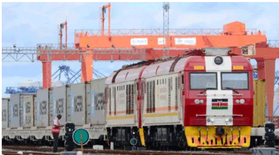
ภาพ : Standard Gauge Railway เส้นทาง Nairobi –Mombasa

ทั้งนี้ ระบบรางดังกล่าวมีคุณภาพและมาตรฐานเดียวกันกับระบบรถไฟที่จะก่อสร้างใน แทนซาเนีย ยูกันดา และ เอธิโอเปีย เพื่อเชื่อมโยงทางรถไฟทั้งหมดเข้าด้วยกัน ตามแผนงานน่าจะทำการเชื่อมโยงกันได้ไปอีก 5-8 ปีข้างหน้า เพื่อใช้ทดแทนระบบถนนที่มีค่าใช้จ่ายสูงและใช้เวลานานมากกว่า