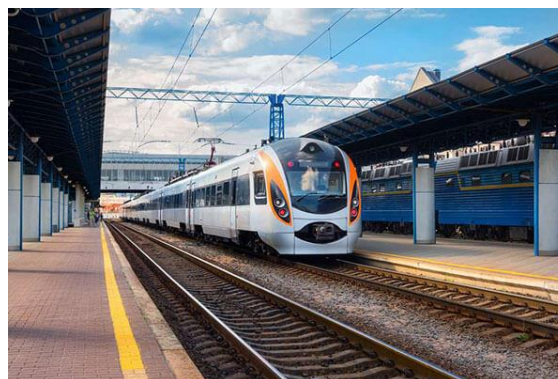
ภาพ : โครงการทางรถไฟ SGR เส้นทาง Dar es Salaam-Morogoro