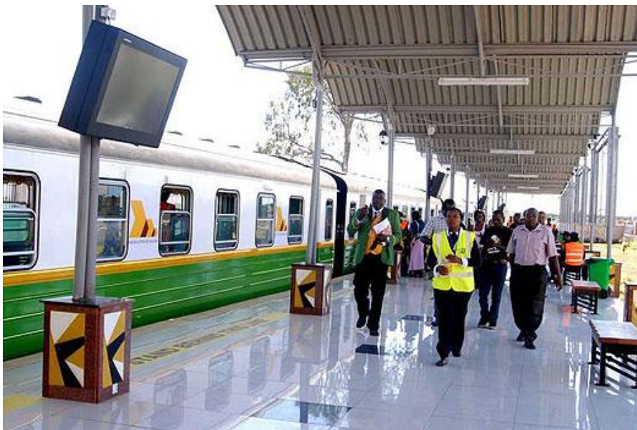
ภาพ: สถานีรถไฟแห่งหนึ่งชานกรุงไนโรบีที่รัฐบาลเคนยาต้องการจะปรับปรุงเป็น Standard Gauge Railway