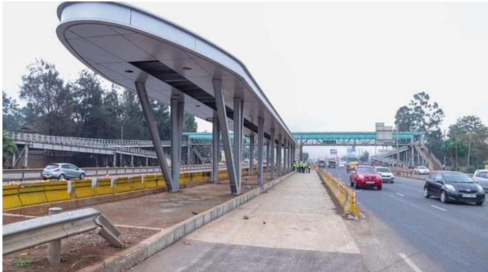
ภาพ : การปรับปรุงถนน Tika Road ที่เป็นเส้นทางหนึ่งของโครงการ Nairobi Bus Rapid Transit (BRT)

นำเอารถโดยสารไฟฟ้า (Electric Bus) มาใช้ในการเดินทางดังกล่าว นอกจากนั้น อาจจะรวมถึงการใช้ระบบรถราง ในเส้นทางเดียวกันด้วยในอนาคต