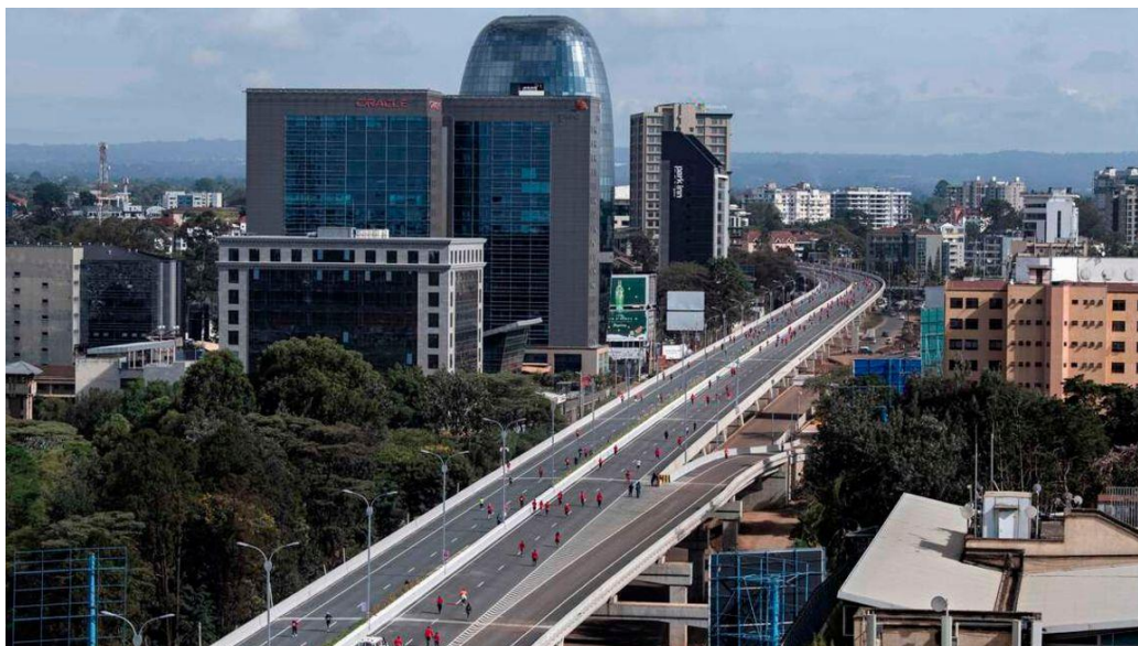
ภาพ : มุมมองทางอากาศของนักวิ่งที่เข้าร่วมการวิ่งมาราธอนไนโรบีบนทางด่วนสายใหม่ เมื่อวันที่ 8 พฤษภาคม 2022