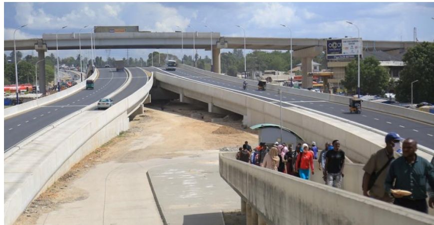
ภาพ: โครงการสะพานลอยฟ้า Mfugale Overpass ที่เริ่มทดลองใช้แล้วในปัจจุบัน

เป็นทางด่วนลอยฟ้าที่เชื่อมโยงสนามบิน Julius Nyerere International Airport และตัวเมือง Dar es Salaam กำหนดแล้วเสร็จในเดือน กันยายน 2565