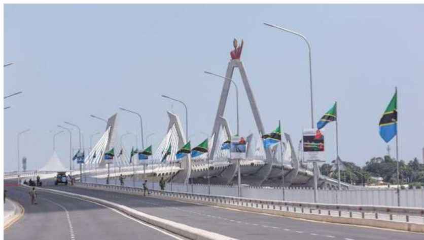
ภาพ: โครงการสะพานแขวน Tanzanite bridge ในเมือง Dar es Salaam เปิดใช้เมื่อเดือน มี.ค. 2565

เพื่อเชื่อมโยงย่านธุรกิจสำคัญของเมือง กับเขตพื้นที่ท่องเที่ยวและสถานที่สำคัญในเขต Kigamboni, Oysterbay and Masaki เพื่อให้เกิดการขยายเมืองให้สามารถลดความแออัดและคับคั่งทางการจราจรได้ โดยสะพานนี้เป็นสะพานแห่งที่ 2 ของเมือง Dar es Salaam ที่เชื่อมเขตธุรกิจดังกล่าว ทำให้ลดเวลาในการเดินทางได้เป็นอย่างดี