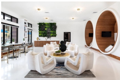
รูปภาพตัวอย่างสินค้าที่เข้าร่วมโครงการ Host&Home และ โครงการการส่งเสริมสินค้าที่มีการออกแบบดีสู่ตลาดโลก

กรมส่งเสริมการค้าระหว่างประเทศ ร่วมกับ สคต. มิลาโน ได้เล็งเห็นถึงความสำคัญของนักออกแบบไทย นวัตกรรม การสร้างสรรค์จากภูมิปัญญาที่ผสมผสานความเป็นสากล และการยกระดับภาพลักษณ์ดีไซน์ของไทยในระดับโลก โดยการสนับสนุนผลงานให้ก้าวสู่ความเป็นสากลและการขยายการส่งออกสินค้าที่มีดีไซน์ผ่านการเข้าร่วมงาน Milan Design Week ได้แก่ 1) โครงการพัฒนาสินค้าและเจาะตลาด Hospitality (Host&Home) ในอิตาลี มีผู้ประกอบการไทย 11 บริษัท ถือเป็นงานเข้าร่วมงานติดต่อกันเป็นปีที่ 6 บนพื้นที่ขนาด 100 ตารางเมตร อาคาร 8 (Design Hall) คูหาเลขที่ B37 ซึ่งสินค้าที่นำมาจัดแสดงของผู้ประกอบการไทยจะมีทั้งสินค้าเฟอร์นิเจอร์สำหรับภายในและภายนอก รวมถึงของตกแต่งภายใน โดยรูปแบบของคูหาจะอยู่ภายใต้คอนเซ็ปต์ Blu Mood และ 2) โครงการส่งเสริมสินค้าที่มีการออกแบบดีสู่ตลาดโลก มีดีไซน์เนอร์ผ่านการคัดเลือกและร่วมแสดงสินค้า 30 ราย และโครงการส่งเสริมนักออกแบบดีสู่ตลาดโลก ในงาน Milan Design Week 2022 มีดีไซน์เนอร์ผ่านการคัดเลือกและร่วมแสดงสินค้า 15 ราย โดยทั้ง 2 โครงการเข้าร่วมจัดแสดงสินค้าในย่านที่ได้รับความนิยมและได้รับความสนใจมากที่สุดในมิลาโน Superstudio Più ในพื้นที่ My Own Gallery ขนาดพื้นที่ 280 ตร.ม. แบ่งเป็น 2 ชั้น โดยมีการนำเสนอสินค้าดีไซน์ ได้แก่ สินค้าเฟอร์นิเจอร์ ของตกแต่ง มอเตอร์ไซค์ และเรือคายัค เป็นต้น โดยแนวคิดของนิทรรศการในครั้งนี้ คือ “UNCERTAINTY = CERTAINTY”