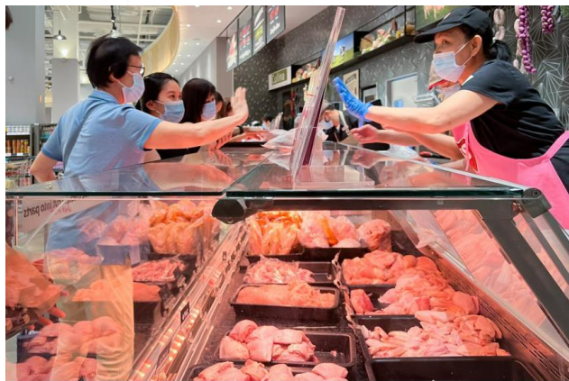
Customers queuing up to buy fresh chicken from Malaysia at a FairPrice outlet in VivoCity on May 24, 2022.