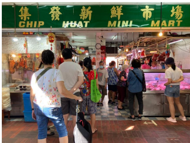
Customers queuing for fresh poultry at Chip Huat Mini Mart at 262 Serangoon Central Drive on May 24, 2022.

ผู้ขายเนื้อไก่ในสิงคโปร์บางรายกล่าวว่า มาตรการของมาเลเซียในการหยุดการส่งออกไก่ในวันที่ 1 มิถุนายน 2565 จะส่งผลกระทบต่อธุรกิจของพวกเขา เพราะไก่ส่วนใหญ่มาจากมาเลเซีย และอาจจะต้องปิดแผงขายชั่วคราว รวมถึงราคาไก่จะเพิ่มขึ้นประมาณ 10-30% ทำให้จำเป็นต้องขายแพงขึ้น และหวังว่าการนำเข้าจากประเทศอื่นๆ เช่น จีน หรืออินโดนีเซีย จะช่วยทดแทนปัญหาการขาดแคลนดังกล่าวได้ ในขณะที่ผู้ขายบางรายกลับไม่กังวลต่อสถานการณ์นี้มากนัก โดยมองว่ามาเลเซียไม่น่าจะหยุดการส่งออกไก่ได้นาน ถึงแม้ว่าไก่สดของที่ร้านจะมาจากมาเลเซียทั้งหมด แต่ทางร้านยังมีไก่แช่แข็งที่มาจากบราซิล ออสเตรเลีย และเดนมาร์ก ในขณะที่ผู้บริโภคยังไม่แสดงความกังวลต่อเหตุการณ์ดังกล่าวมากนัก เพราะสามารถเปลี่ยนไปซื้อเนื้อสัตว์ชนิดอื่น หรือไก่แช่แข็งที่มาจากประเทศอื่นๆ เพื่อแก้ปัญหาที่เกิดขึ้นได้ และบางรายระบุว่า มีแนวโน้มที่จะซื้อเนื้อไก่ต่อไป หากราคาไม่ขึ้นสูงจนเกินไป