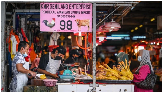
Chicken supply and pricing issues have been a concern in Malaysia in the past few months.

เมื่อวันที่ 23 พฤษภาคม 2565 นายกรัฐมนตรีมาเลเซีย Ismail Sabri Yaakob ได้ประกาศว่า มาเลเซียจะหยุดการส่งออกไก่สดทั้งตัว ซึ่งคิดเป็นจำนวน 3.6 ล้านตัวต่อเดือน เพื่อแก้ไขปัญหาราคาไก่ที่สูงขึ้นและการขาดแคลนในประเทศ โดยจะเริ่มมีผลบังคับใช้ในวันที่ 1 มิถุนายน 2565 จนกว่าภาคการผลิตและราคาไก่ในประเทศจะคงที่