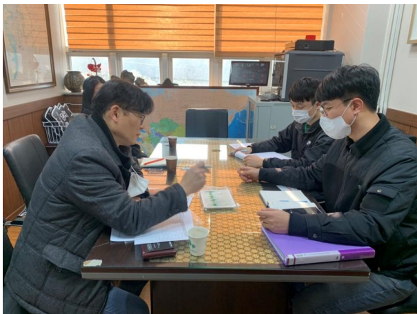
ภาพระหว่างการเข้าพบ