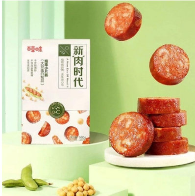
ไส้กรอกแผ่นนมควันทานเล่น แบรนด์ Be & Cheery

ขนมจากพืชตัวแรกของจีน และแบรนด์ Yake (雅客:อย่าเค่อ) ได้ออกเนื้อแผ่นทานเล่นสูตรเจหลากหลายรสวางจำหน่ายในท้องตลาดจีน อาทิ รสพะโล้ รสบาร์บีคิว รสเผ็ด และรสเผ็ดซาหามาล่า เป็นต้น