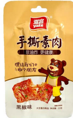
เนื้อแผ่นทานเล่นสูตรเจ แบรนด์ Yake