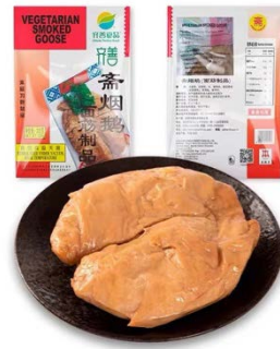
เนื้อทานรมควัน แบรนด์ Whole Perfect Food