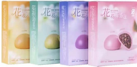
ซาลาเปาสอดไส้เนื้อสัตว์ทำจากพืช แบรนด์ Starfield

ออกจำหน่ายผลิตภัณฑ์เนื้อสัตว์จากพืชหลากหลายรูปแบบไม่แพ้กัน อาทิ แผ่นเนื้อวัวสไลด์สำหรับชาบู เนื้ออย่างเกาหลี และเนื้อสันในหั่นชิ้น ขณะที่ธุรกิจสตาร์ทอัพด้านอาหารหลากหลายแบรนด์ของจีนก็เริ่มทยอยคิดค้นผลิตภัณฑ์เนื้อสัตว์จากพืชที่แปลกใหม่และมีความหลากหลายออกจำหน่ายสู่ท้องตลาดมากขึ้น อาทิ ซอสปรุงรสเนื้อวัว เนื้อหมูสามชั้นแผ่นจากแบรนด์ Xinsushi (新素食:ซินซูสี), เบอร์เกอร์เนื้อไก่ ชินเนื้อวัวพริกไทยดำจากแบรนด์ Starfield (星期零:ซิงซีหลิง) รวมถึงขนมไหว้พระจันทร์จาก แบรนด์ Zhen Meat (珍肉:เจินยิว) เป็นต้น