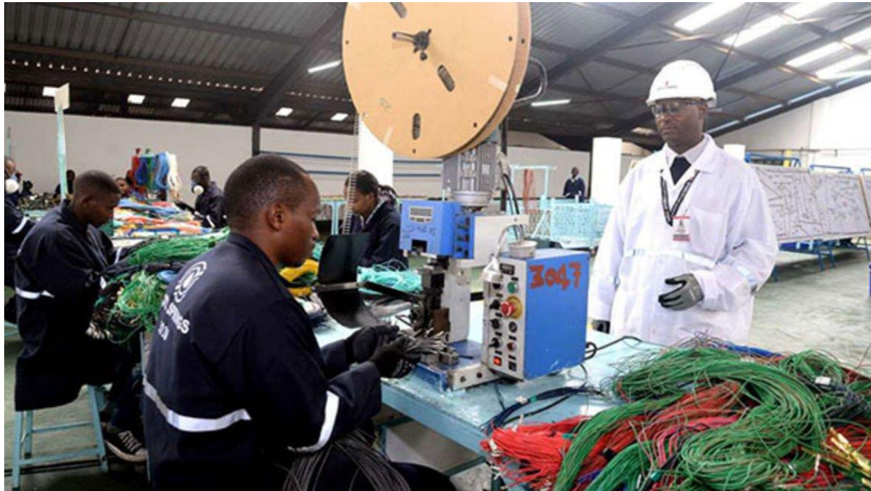
ภาพ : คนงานที่ Auto Springs East Africa ขณะทำงานในโรงงานที่เขตเคียมบู ประเทศเคนยา เมื่อวันที่ 8 พฤษภาคม 2018 การผลิตเป็นหนึ่งในภาคส่วนที่ได้รับผลกระทบมากที่สุดของเศรษฐกิจในปี 2563

อุตสาหกรรมการผลิตส่วนใหญ่ของประเทศเคนยายังไม่ฟื้นตัวจากผลกระทบทางเศรษฐกิจจากสถานการณ์การแพร่ระบาดของโรคติดเชื้อไวรัสโคโรนา 2019 (Covid-19) เนื่องจาก เหตุผลหนึ่งที่สำคัญคือต้นทุนด้านสินเชื่อในการประกอบธุรกิจ