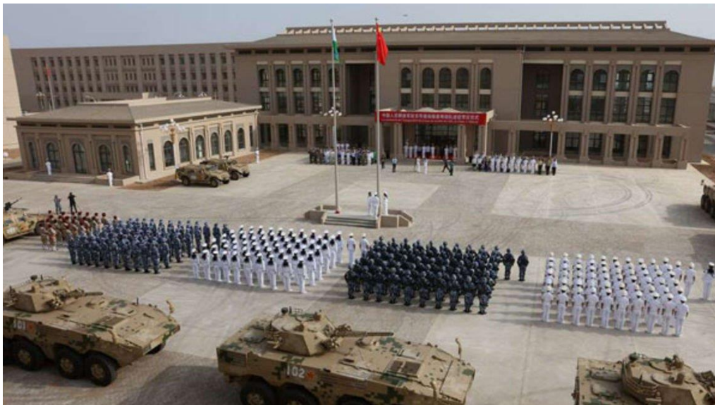
ภาพ : กองทัพปลดแอกประชาชนจีนในการเปิดฐานทัพใหม่ในจิวตีเมื่อเดือนสิงหาคม 2560

จีนปฏิเสธข้อกล่าวอ้างของสหรัฐฯ ที่ว่า จีนกำลังพยายามสร้างฐานทัพทหารในเคนยา ซึ่งเป็นส่วนหนึ่งของ ยุทธศาสตร์การขยายอำนาจไปยังแอฟริกา ในรายงานประจำปีของกระทรวงกลาโหมของสหรัฐฯ ที่มีต่อรัฐสภา เกี่ยวกับการทหารของจีน กล่าวอ้างว่า จีนกำลังมองหาฐานที่มั่นในการขนส่งทางทหารในประเทศแถบแอฟริกา หลายประเทศ รวมถึงเคนยาและแทนซาเนีย ที่อยู่ใกล้เคียง