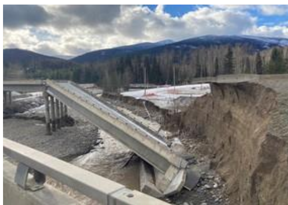
แผนที่แสดงพื้นที่น้ำท่วม / ดินถล่มในรัฐบริติชโคลัมเบีย และเส้นทางถนนไฮเวย์สายหลักตัดขาด

เพราะนอกเหนือจากค่าใช้จ่ายที่เกิดขึ้นจากการช่วยเหลือประชาชนและซ่อมแซมความเสียหายในพื้นที่ประสบภัยแล้วนั้น นักวิเคราะห์เศรษฐกิจในประเทศมองว่า อุทกภัยครั้งนี้คิดเป็นมูลค่าความเสียหายทางเศรษฐกิจในประเทศระดับสูงมากเช่นกัน แต่ขณะนี้ยังไม่สามารถประเมินตัวเลขได้ ขึ้นอยู่กับระยะเวลาที่เส้นทางการขนส่งจะกลับมาใช้ได้อย่างปลอดภัย และแน่นอนว่าจะกระทบผ่านห่วงโซ่อุปทานอย่างเลี่ยงไม่ได้ เนื่องจากปริมาณและมูลค่าขนส่งสินค้าเข้าออกที่ท่าเรือแวนคูเวอร์มากถึงวันละ 550 ล้านดอลลาร์สหรัฐฯ หรือ 19,900 ล้านบาท และตามข้อมูลสถิติการค้าในประเทศแสดงให้เห็นถึงมูลค่าการค้าระหว่างรัฐบริติชโคลัมเบียและรัฐอื่นๆ ในปี 2560 อยู่ที่สัปดาห์ละ 2,000-2,500 ล้านดอลลาร์สหรัฐฯ หรือ 72,000-90,000 ล้านบาทไทย โดยมีสินค้าผ่านเข้าออก อาทิ ธัญพืช ถั่วเหลือง รมยนต์ และสินค้าจำเป็นร่วมหลายรายการ