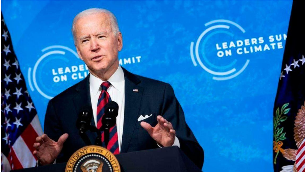
ภาพ : ประธานาธิบดี โจ ไบเดน แห่งสหรัฐฯ พุดระหว่างการประชุมสุดยอด เมื่อวันที่ 22 เมษายน พ.ศ. 2564 ในกรุงวอชิงตัน ดี.ซี.

หลังจากที่สหรัฐฯ ได้ประกาศระงับการนำเข้าสินค้าที่ส่งออกจากเอธิโอเปีย มีผลทางจิตวิทยาและคาดการณ์ว่า เคนยาดูเหมือนจะได้เป็นประเทศที่ได้รับประโยชน์หลังเหตุการณ์ความไม่สงบจากสงครามในประเทศระหว่างกลุ่ม กบฏไทเกรย์และรัฐบาลเอธิโอเปีย โดยการที่สหรัฐฯ ออกคำสั่งแบนสินค้าจากเอธิโอเปียเป็นการเปิดโอกาสให้ บริษัทสิ่งทอและเครื่องนุ่งห่มในเคนยาน่าจะสามารถเพิ่มปริมาณการส่งออกไปยังตลาดสหรัฐฯ ด้วยผลิตภัณฑ์ มากกว่า 6,000 รายการ