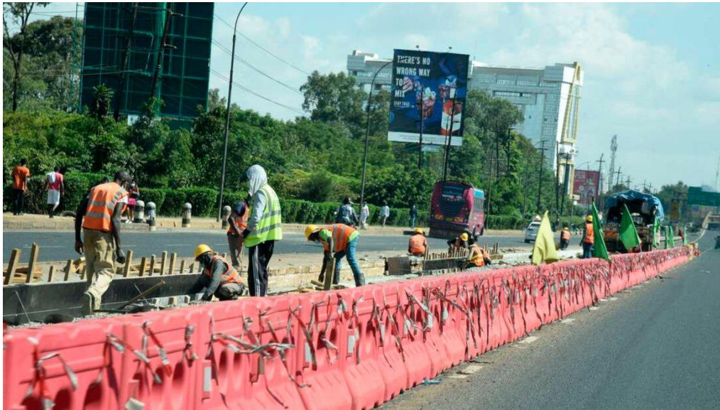
ภาพ : งานถนนสำหรับโครงการรถโดยสารด่วนพิเศษ (BRT) ที่กำลังก่อสร้างตามถนนซูเปอร์ไฮเวย์ เมื่อวันที่ ๗ มิถุนายน พ.ศ. ๒๕๖๔

รัฐบาลเคนยาได้ตกลงกู้ยืม ๖.๔ พันล้าน KES จากรัฐบาลเกาหลีเพื่อเป็นเงินทุนสำหรับ โครงการรถโดยสารด่วนพิเศษ (Bus Rapid Transport - BRT) โดยรัฐบาลย้ายไปกู้เงินที่ธนาคารเพื่อการส่งออกและนำเข้าของเกาหลีในระยะยาว จนถึงวันที่ ๒๙ มกราคม พ.ศ. ๒๖๐๔