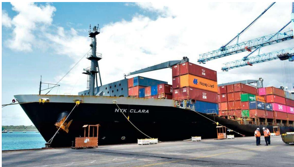
ภาพ : เรือบรรทุกสินค้าของสิงคโปร์ NYK Clara เทียบท่าที่ท่าเรือมอมบาซา

มูลค่าการนำเข้าอาหารของเคนยาแตะระดับสูงสุดเป็นประวัติการณ์ในช่วง 6 เดือน (ช่วงเดือน มกราคม ถึง มิถุนายน) ซึ่งจะเป็นจำพวก อาหาร รวมถึงสัตว์เลี้ยงในฟาร์มที่ยังมีชีวิต เพื่อทั้งหมดไปทำเป็นอาหารและขยายพันธุ์ และเครื่องดื่ม มูลค่า 103.34 พันล้าน KES ซึ่งเพิ่มขึ้นเป็นมูลค่า 12.35 พันล้าน KES หรือ 13.57% เปรียบเทียบในช่วงเวลาเดียวกันของปีที่แล้ว ที่มีมูลค่า 91 พันล้าน KES ทั้งนี้ เกิดจากภัยแล้งที่รุนแรงส่งผลกระทบต่อพืชผลและการผลิตอาหารสัตว์ ทำให้เกิดวิกฤตระดับชาติที่บังคับให้กระทรวงการคลังอนุญาต เงินอุดหนุนและยกเว้นอากรขาเข้าเพื่อจัดซื้ออาหารเป็นหลัก เพื่อชดเชยการขาดแคลนการผลิตในท้องถิ่น ประกอบกับ ค่าเงินที่อ่อนค่าลงเมื่อเทียบกับดอลลาร์สหรัฐฯ