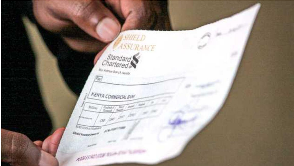
ภาพ : ตัวอย่างเช็คในธนาคารแห่งหนึ่งในเคนยา

ในช่วงครึ่งปีแรกของปี 2564 การชำระเงินด้วยเช็คผ่านธนาคารเพิ่มขึ้น 8.29% ติดตัวขึ้นจากการลดลงด้วยเลขสองหลักที่เกิดจากสถานการณ์โควิดในช่วงเดียวกันเมื่อปีที่แล้ว ซึ่งขณะนั้น ส่งผลให้ผู้ใช้บริการลดการเข้าธนาคาร