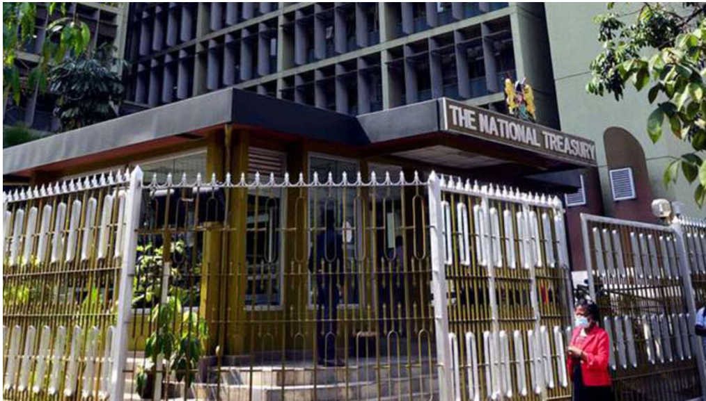
ภาพ : อาคารสำนักงานกระทรวงการคลัง ประเทศเคนยา

นักเศรษฐศาสตร์ทั่วโลกคาดการณ์ว่า การขาดดุลงบประมาณของเคนยาจะมีมากกว่า -๗.๕% ของผลิตภัณฑ์มวลรวมภายในประเทศ (GDP) ที่ประมาณการไว้ปีงบประมาณนี้ โดยอาจจะไม่บรรลุเป้าหมายการเติบโตทางเศรษฐกิจและการจัดเก็บรายได้จากภาษีที่รัฐบาลเคนยาวางแผนไว้