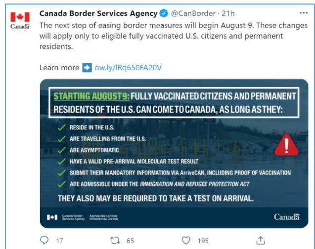
แถลงการณ์จากหน่วยงาน Canada Border Services Agency

การฉีดวัคซีน 2 เข็ม (แต่เดิมก่อนวิกฤต Covid-19 ชาวอเมริกันสามารถเดินทางเข้าแคนาดาได้โดยใช้เอกสารพาสปอร์ต หรือบัตรประชาชนเท่านั้น ไม่ต้องมีการลงทะเบียนหรือขอวีซ่าล่วงหน้า) ในส่วนของชาวต่างชาติอื่นๆ นั้น รัฐบาลแคนาดาจะอนุญาตให้สามารถเดินทางมายังแคนาดาได้ สำหรับกลุ่ม Non-Essential Travel เมื่อได้รับวัคซีนครบ 2 เข็มแล้ว เริ่มวันอังคารที่ 7 กันยายน 2564 ทั้งนี้ รัฐบาลแคนาดาเน้นย้ำว่ากฎระเบียบดังกล่าวขึ้นกับสถานการณ์การแพร่ระบาดทั้งภายในประเทศ และทั่วโลกที่อาจมีการเปลี่ยนแปลงหากจำเป็น