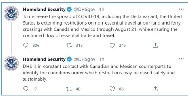
แถลงการณ์จากหน่วยงาน Homeland Security (สหรัฐฯ)