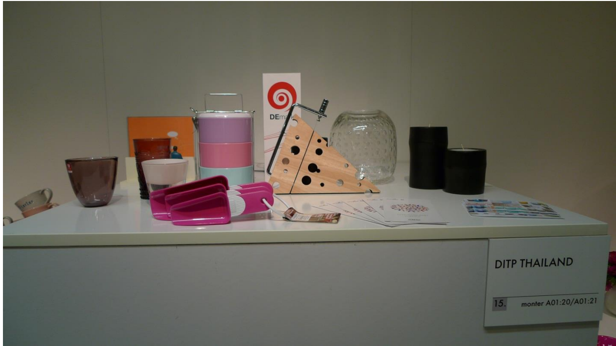
การจัดประชาสัมพันธ์สินค้า Display ณ Newstable อาคาร B