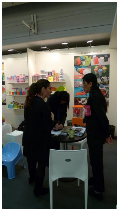
การประชาสัมพันธ์ ณ คูหาสคร. โคเปนเฮเกน