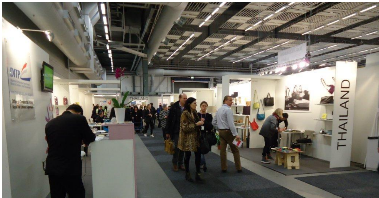
รูปแบบของคูหา DITP THAILAND

สำนักงานส่งเสริมการค้าระหว่างประเทศ ณ กรุงโคเปนเฮเกน