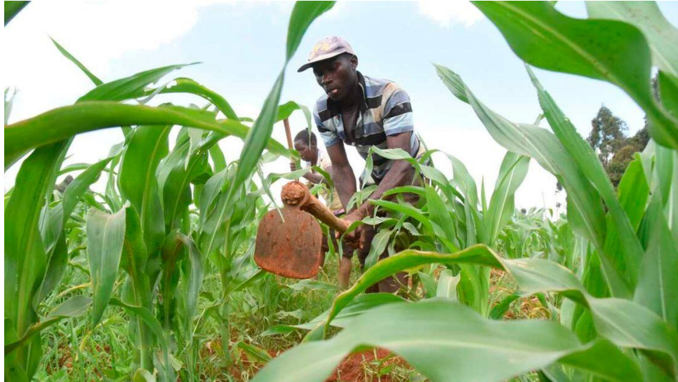
ภาพ : เกษตรกรกำลังกำจัดวัชพืชในฟาร์มข้าวโพดใน Bondeni เขต Uasin Gishu

กลุ่มบริษัทสัญชาติอิตาลี Maire Tecnimont SPA ได้เริ่มก่อสร้างโรงงานผลิตปุ๋ยมูลค่า 32.4 พันล้านบาท KES (500 ล้านดอลลาร์สหรัฐ) ในเมืองNaivasha โดยคาดว่าจะช่วยให้ต้นทุนผลผลิตลดลง