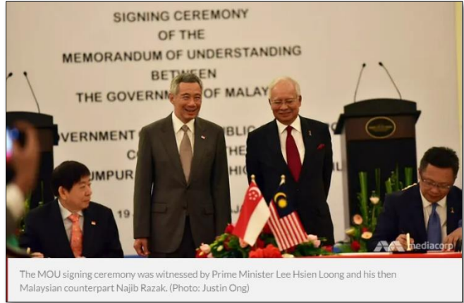
The MOU signing ceremony was witnessed by Prime Minister Lee Hsien Loong and his then Malaysian counterpart Najib Razak.