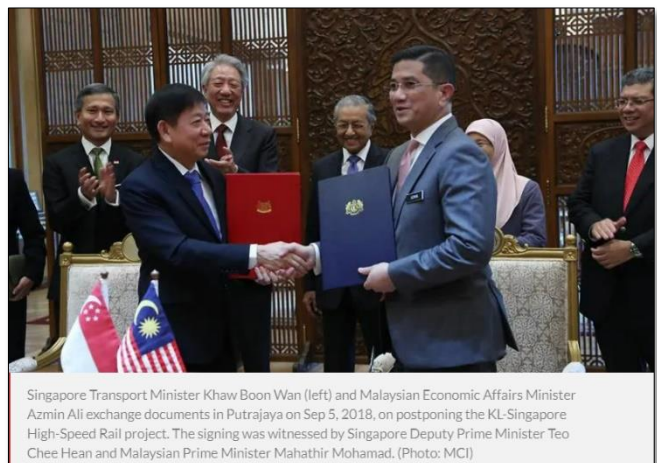
Singapore Transport Minister Khaw Boon Wan (left) and Malaysian Economic Affairs Minister Azmin Ali exchange documents in Putrajaya on Sep 5, 2018, on postponing the KL-Singapore High-Speed Rail project. The signing was witnessed by Singapore Deputy Prime Minister Teo Chee Hean and Malaysian Prime Minister Mahathir Mohamad.

การประกาศเลื่อนโครงการ HSR สิงคโปร์-กัวลาลัมเปอร์ครั้งแรกเกิดขึ้นเมื่อเดือนพฤษภาคม 2561 หลังจากการเลือกตั้งครั้งประวัติศาสตร์ของมาเลเซีย ที่ Dr Mahathir Mohamad ชนะการเลือกตั้งและได้รับการแต่งตั้งเป็นนายกรัฐมนตรีมาเลเซีย แทนนาย Najib Razak โดย Dr Mahathir Mohamad ได้แถลงข่าวว่าจะมีการศึกษาและทบทวนสัญญาโครงการระหว่างประเทศต่างๆ รวมทั้งโครงการ HSR และต่อมาได้ให้สัมภาษณ์กับ Financial Times ว่า โครงการ HSR จะใช้งบประมาณ 110 พันล้านริงกิต 2 (830.5 พันล้านบาท) แต่จะไม่สร้างรายได้ให้กับมาเลเซียแม้แต่ริงกิตเดียว หลังจากนั้นในเดือนกรกฎาคม 2564 นายกรัฐมนตรีมาเลเซีย Dr Mahathir Mohamad ประกาศว่า รัฐบาลมาเลเซียจะเจรจากับสิงคโปร์เพื่อขอเลื่อนโครงการ HSR ออกไป เนื่องจากหลังจากพิจารณาการเงินของมาเลเซียแล้ว คิดว่ามาเลเซียไม่สามารถร่วมโครงการต่อไปได้ ต่อมาในเดือนกันยายน 2561 สิงคโปร์และมาเลเซียได้ลงนามในความตกลงใหม่ เพื่อการเลื่อนโครงการ HSR ออกไปจนถึงสิ้นเดือนพฤษภาคม 2563 และมีการเลื่อนการเริ่มโครงการออกไปเป็นวันที่ 1 มกราคม 2574 แทนวันที่ 31 ธันวาคม 2569 ทั้งนี้ ในขอการเลื่อนโครงการนี้ ทางมาเลเซียต้องจ่ายเงินชดเชยให้กับสิงคโปร์จำนวน 15 ล้านเหรียญสิงคโปร์ (349.2 ล้านบาท) สำหรับค่าใช้จ่ายที่เกิดขึ้นในการระงับโครงการ และหากมาเลเซียไม่สามารถทำตามสัญญาจะต้องรับผิดชอบภาระค่าใช้จ่ายที่เกิดขึ้น