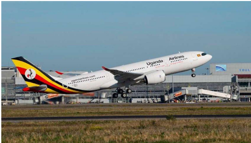
ภาพ : สายการบินยูกันดา A330-800 Neo บินออกจากเมือง Toulouse ฝรั่งเศส

สายการบินยูกันดาได้ลงทุนในการซื้อช่องลงจอดเครื่องบินในสนามบิน Heathrow ในอังกฤษ ซึ่งคล้ายกับกรณีสายการบินเคนยาที่ขายให้สายการบินโอมานในปี 2559 โดยการเข้าซื้อช่องลงจอดเครื่องบินของสายการบินยูกันดาเป็นสิ่งสำคัญเพื่อแข่งขันกับสายการบินในภูมิภาคอื่น ๆ เนื่องจาก สนามบินดังกล่าวเป็นจุดสำคัญของเหล่านักธุรกิจที่มีฐานะร่ำรวยในแอฟริกาที่ต้องการจะเดินทางไปยังแถบยุโรป จากที่ทำอากาศยานได้ประกาศว่า จะมีเที่ยวบินลงจอดที่ Heathrow ของ สหราชอาณาจักร เวลา 06.00 น. และมีเที่ยวบินออกเดินทางไปยัง Entebbe ของ ยูกันดา เวลา 09.00 น. เป็นการกระตุ้นความสนใจให้กับสายการบินต่างๆ เนื่องจากมองว่า มีผู้เดินทางไปลอนดอนจำนวนมาก โดยเฉพาะอย่างยิ่งนักธุรกิจที่เดินทางไปลอนดอนในเที่ยวบินเช้า และเมื่อเสร็จจากการเจรจาธุรกิจ ก็จะเดินทางกลับในช่วงเย็น