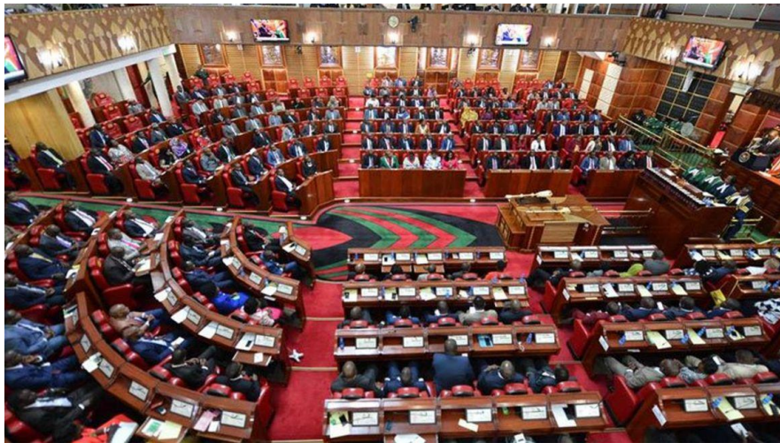
ภาพ รัฐสภาเคนยาท่ามกลางการอภิปรายของสมาชิกสภาผู้แทนราษฎร

เมื่อเย็นวันอังคารที่ผ่านมา (9 มี.ค.2564) รัฐสภาเคนยาได้ลงมติเห็นชอบข้อตกลงการค้าระหว่างเคนยากับสหราชอาณาจักร ซึ่งเป็นข้อตกลงการค้าที่มีความสำคัญสำหรับการส่งออกสินค้าจากเคนยาโดยไม่มีภาษีไปยังสหราชอาณาจักร