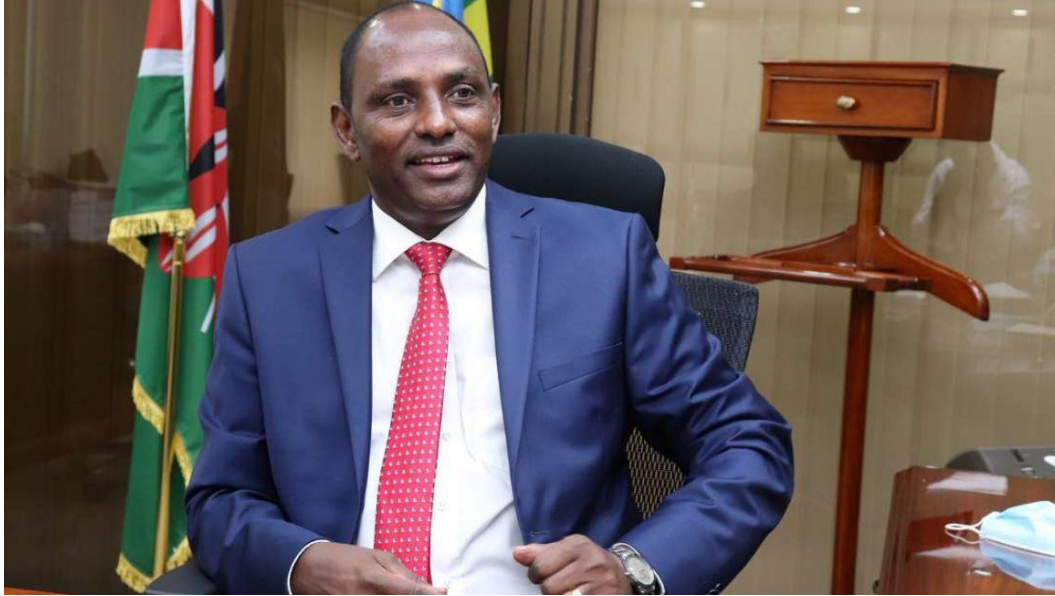
ภาพ : รัฐมนตรีว่าการกระทรวงการคลังเคนยา นาย Ukur Yatani

สถาบันจัดอันดับเครดิตระดับโลก S&P ได้ปรับลดอันดับความน่าเชื่อถือของเคนยา ส่งผลให้ลดโอกาสประเทศเคนยาในการกู้ยืมเงินดอกเบี้ยต่ำในตลาดต่างประเทศ