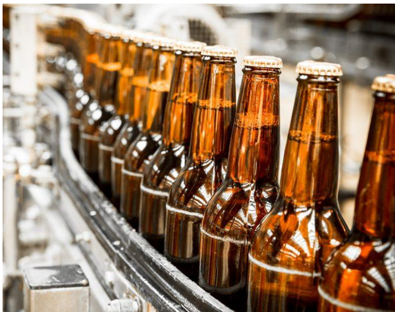
ภาพ : สายการผลิตเบียร์ ขนาด ๒๕๐ มล. ที่เดินเครื่องอยู่ในปัจจุบัน