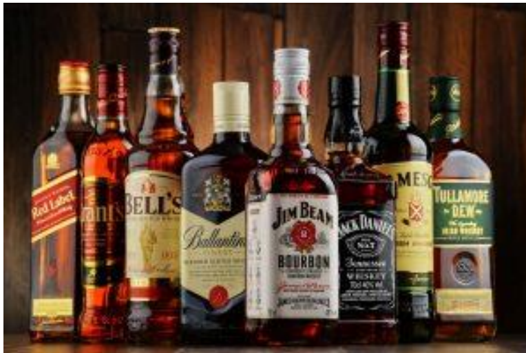
ภาพ : ขวดที่มีการเปลี่ยนแปลงเพิ่มขนาดที่มากขึ้น ขนาด 750 มล.

ร่างกฎหมายข้อเสนอนี้ หากมีการนำเสนอตามที่สมาชิกวุฒิสภาเคนยาต้องการนั้น จะทำให้เคนยาเป็นประเทศเดียวเท่านั้นที่มีเกณฑ์การกำหนดบรรจุภัณฑ์ที่สูงที่สุดในโลก ในขณะที่อุตสาหกรรมเครื่องดื่มแอลกอฮอล์จะต้องเผชิญวิกฤตมากขึ้น ท่ามกลางการล่มสลายทางเศรษฐกิจ อันเนื่องมาจาก การระบาดของ Covid-19 เพิ่มไปอีกด้วย โดยในปัจจุบันของกฎหมาย (ปี 2010) ได้กำหนดโทษของผู้ที่ละเมิดข้อกำหนดบรรจุภัณฑ์ดังกล่าว มีโทษปรับ 50,000,000 Sh (ประมาณ 15 ล้านบาท) หรือ จำคุก 6 เดือน หรือ ทั้งจำทั้งปรับ อย่างไรก็ตาม หากสมาชิกวุฒิสภาในจำนวนมากกว่ากึ่งหนึ่งเห็นชอบที่จะนำร่างกฎหมายดังกล่าวเข้าสู่การพิจารณาโดยไม่สนใจข้อคัดค้านของคณะกรรมการฯ แล้ว ก็ขึ้นอยู่กับว่าสมาชิกฝ่ายนิติบัญญัติจะลงคะแนนปฏิเสธ หรือ เห็นด้วย กับร่างดังกล่าวหรือไม่ต่อไป