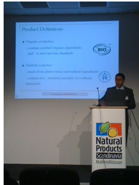
ภาพบน: สินค้าเพื่อสุขภาพ และความงามภายในงาน