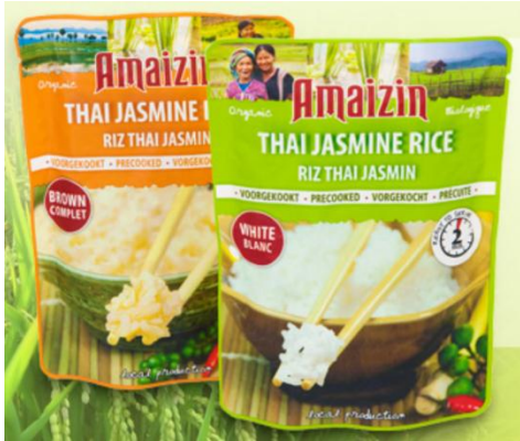
ผลิตภัณฑ์ข้าวหอมมะลิพร้อมรับประทาน จากบริษัท Dutch Organic International Trade

๔.๔ สินค้าจากประเทศไทยที่พบเห็นภายในงาน เช่น ข้าวหอมมะลิสำเร็จรูปพร้อมรับประทาน เครื่องแกง และน้ำมะพร้าวพร้อมดื่ม เป็นต้น