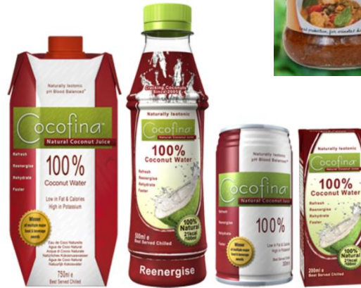
ผลิตภัณฑ์น้ำมะพร้าวพร้อมดื่ม จากบริษัท Fina Brand Limited

สินค้าไทยที่จัดแสดงในงาน Natural Products Scandinavia 2012