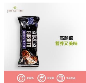
เนื้อสัตว์ทำจากพืช