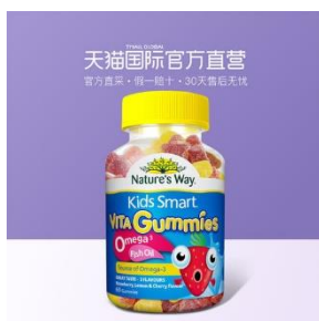
เยลลีน้ำมันปลา

(1) อาหารและเครื่องดื่มเพื่อสุขภาพที่มีความแปลกใหม่ อาทิ เครื่องดื่มที่มีส่วนประกอบของกรดไฮยาลูโรนิก (Hyaluronic Acid) สารบำรุงผิวพรรณเพื่อความงาม เนื้อสัตว์ทำจากพืช (Plant-based Meat) นมจากพืช ลูกอมหรือเยลลี่ที่มีส่วนผสมของสารอาหารและวิตามินต่างๆ เช่น ลูกอมเมลาโทนิน เยลลีน้ำมันปลา เป็นต้น