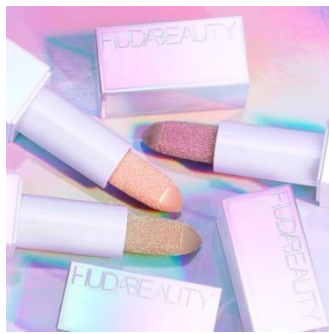
ลิปสติกแบรินด์ Huda Beauty

(5) แบรินด์สินค้าของเหล่าดารารและบล็อกเกอร์ชื่อดังต่างๆ ในปี 2563 ที่ผ่านมาร แบรินด์สินค้าของเหล่าดารารและบล็อกเกอร์ชื่อดังเข้ามาบุกตลาดจีนโดยผ่านแพลตฟอร์มอีคอมเมิร์ซข้ามพรมแดน อาทิ วิกทอเรีย เบคแคม (Victoria Beckham), เทย์เลอร์ สวิฟต์ (Taylor Swift) ต่างเปิดร้านบนแพลตฟอร์ม Tmall Global รวมถึงเครื่องสำอางจากบิวตี้บล็อกเกอร์ที่มีชื่อเสียงระดับโลกอย่าง Huda Beauty, ชาร์ล็อต ทิลบิวรี่ (Charlotte Tilbury) ช่างแต่งหน้าชื่อดังชาวอังกฤษต่างได้รับความนิยมในจีนเป็นอย่างมาก