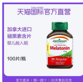
ลูกอมเมลาโทนิน