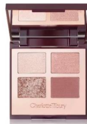
เครื่องสำอางแบรินด์ Charlotte Tilbury