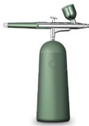
เครื่องฉีดออกซิเจนเสริมความงาม

(3) เครื่องมือและอุปกรณ์เสริมความงามในระดับมืออาชีพ อาทิ เครื่องฉีดออกซิเจนเสริมความงาม เครื่องนวดหน้าบำรุงผิว เครื่องมาสก์หน้า โຕะเครื่องแป้ง เป็นต้น โดยในปี 2563 มูลค่าการอุปโภคผลิตภัณฑ์เสริมความงามบน Tmall Global เพิ่มขึ้นกว่าร้อยละ 200 (YoY)