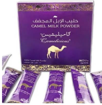
นมอูฐจากคูไบ