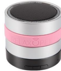
ลำโพงคลายเครียดสำหรับสัตว์เลี้ยง