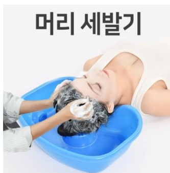
14. อ่างสระผม