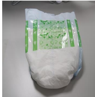
18. แพมเพิสสำหรับผู้สูงอายุ