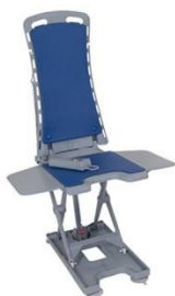
13. ลิฟท์อาบน้ำ