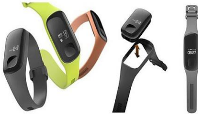
17. เครื่องตรวจจับชีพจร