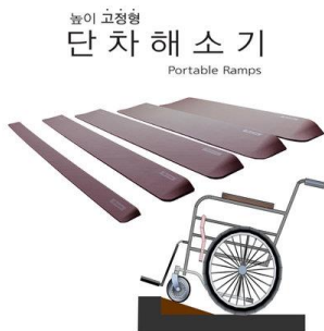
19. ทางลาดแบบพกพา