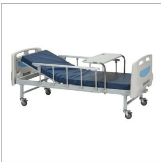
11. เตียงผู้ป่วย