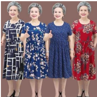
21. ชุดสำหรับผู้สูงอายุ