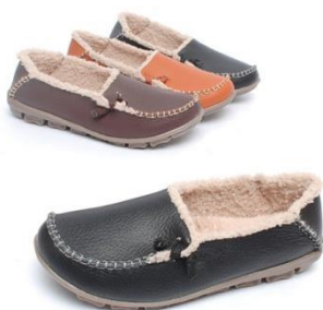
15. รองเท้าสำหรับผู้สูงอายุ