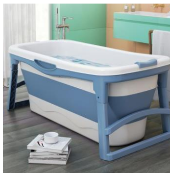
12. อ่างอาบน้ำ