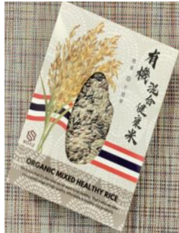
$52 เหยี่ยวฮ่องกง/ กก.