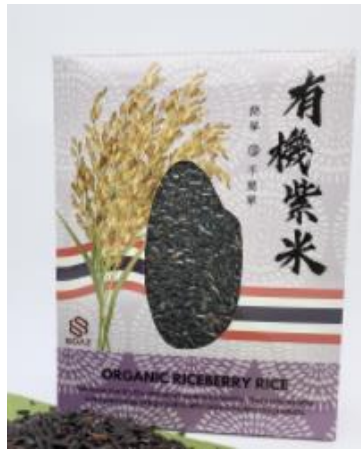
Riceberry $50 เหยี่ยวฮ่องกง