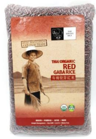
$66 เหยี่ยวฮ่องกง/ กก.