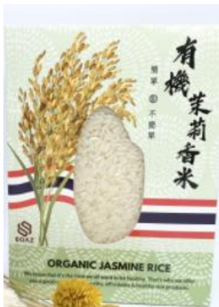
$48 เหยี่ยวฮ่องกง/ กก.