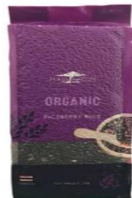
riceberry :$72.90/ 2 กก.