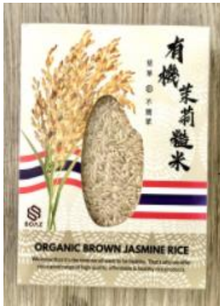
Brown rice $48 เหยี่ยวฮ่องกง/ กก.