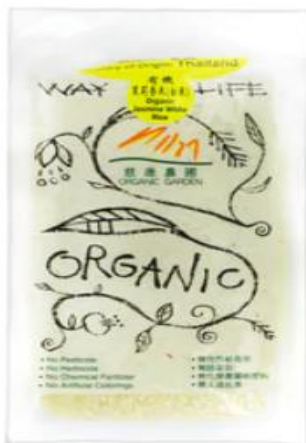
White Rice: $42.90 เหยี่ยว/ กก.