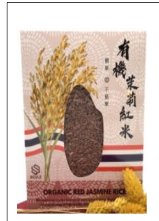
Red rice $50 เหยี่ยวฮ่องกง / กก.