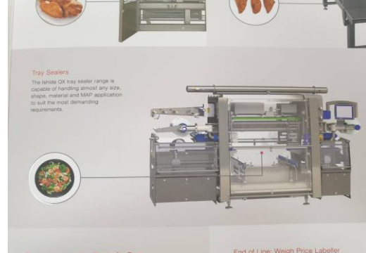
ลักษณะเครื่องจักรที่บริษัทต้องการนำเข้ามาจากประเทศไทย