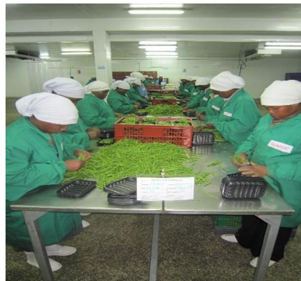
ภาพโรงงานบรรจุผลิตภัณฑ์และลักษณะการคัดแยกผลผลิตเพื่อบรรจุของบริษัท