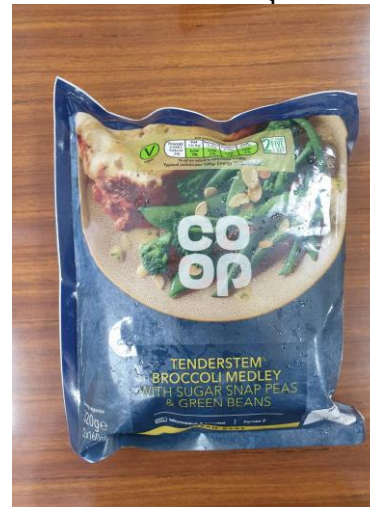
ภาพตัวอย่างสินค้าผักออร์แกนิกส์ที่มีการส่งออกในห้างค้าปลีกชั้นนำของฝรั่งเศสและอังกฤษ