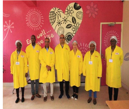
ภาพ ผอ.สศต. และทีมงานของ สศต. ในการเยี่ยมชมกิจการของบริษัท