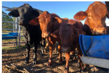
The recycled Taurus tyre mat is designed to stop cattle slipping in high traffic areas.