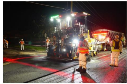
Tyre Stewardship Australia is promoting use of recycled tyre rubber in roads.

ในปี 2562 NSW Environment Protection Authority (EPA) ได้ออกใบอนุญาตให้บริษัท Green Distillation Technologies ในการจัดตั้งโรงงานผลิตน้ำมันและพลังงานหมุนเวียนในเมือง Warren เขต Dubbo รัฐนิวเซาท์เวลส์สำหรับผลิตวัตถุดิบขั้นปฐมภูมิ ได้แก่ น้ำมัน คาร์บอน (ถ่าน) และเหล็ก สำหรับนำไปแปรรูปเป็นสินค้า High-grade อื่นๆ โดยการนำขยะยางรถยนต์เก่ามารีไซเคิลผ่านกระบวนการกลั่นทำลาย