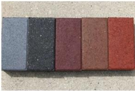
Rubber bricks made from shredded old car tyres with Canadian technology.

(Destructive distillation) ซึ่งโรงงานดังกล่าวมีขีดความสามารถในการกลั่นทำลายอย่างเต็มที่ประมาณ 19,000 ตันต่อปีจากการใช้ยางรถยนต์เก่าประมาณ 685,000 เส้น มาผลิตเป็นน้ำมันได้ประมาณ 7,000 ตัน คาร์บอน 7,000 ตันและเหล็ก 2,000 ตัน นอกจากนี้ บริษัทฯ ยังมีแผนจัดตั้งโรงงานเพิ่มอีก 7 แห่งทั่วออสเตรเลีย