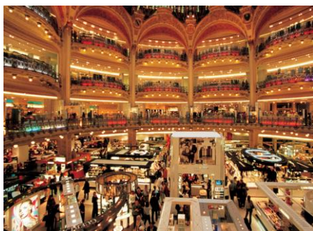
Duty Free Shopping Mall