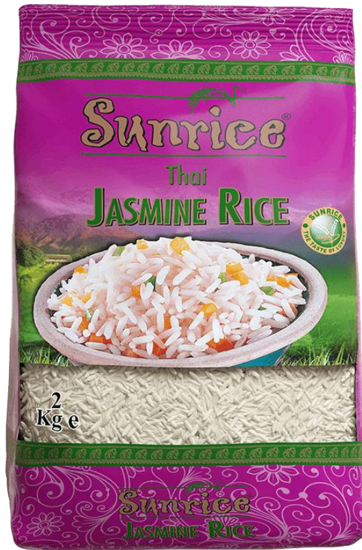
ภาพตัวอย่างสินค้าข้าวที่นำเข้ามาจากไทยที่บริษัทนำเข้าและจำหน่ายในปัจจุบัน

Business Creation & Networking 28 May 2020