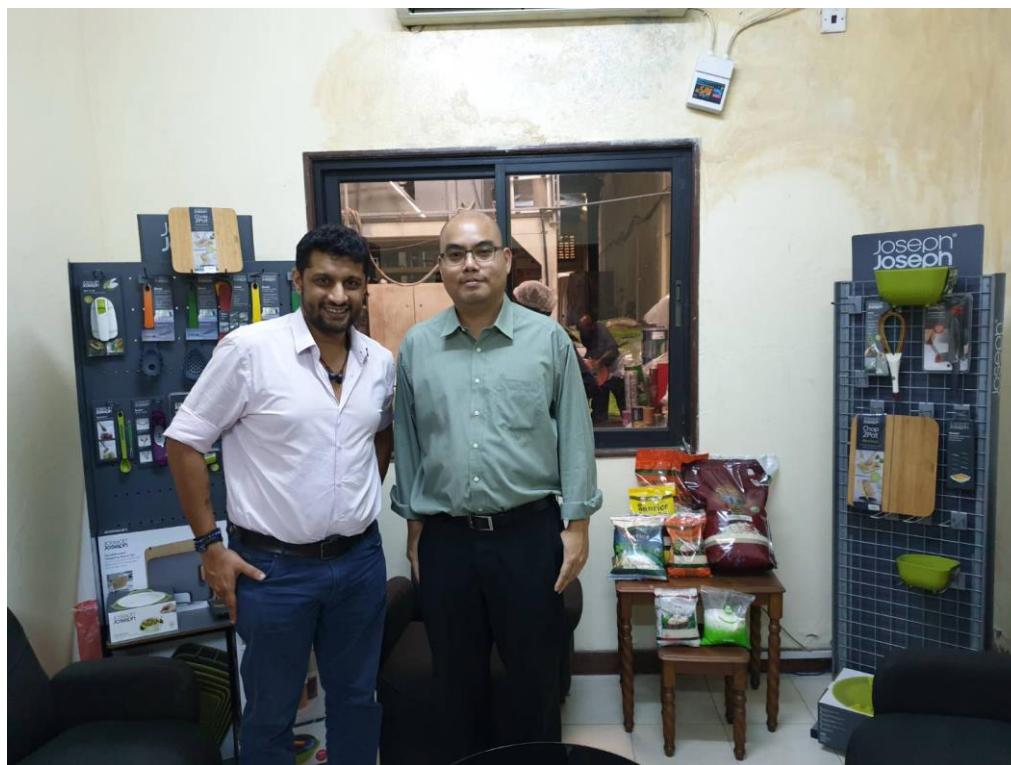
ภาพ ผอ.สศต. (นายณัฐพงศ์) เยี่ยมชมบริษัท และสินค้าของบริษัท