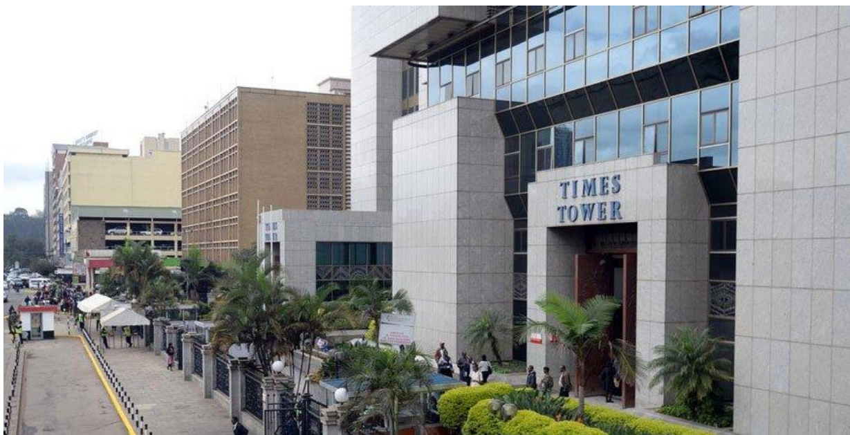
อาคารสำนักงานของกรมสรรพากรเคนยาในกรุงไนโรบี

จากการเปิดเผยของกรมสรรพากรเคนยา และแหล่งข่าวจากผู้นำเข้าเคนยาในสินค้าสำคัญหลายรายการ ได้แก่ อาหาร รถยนต์มือสอง แอลกอฮอล์ เสื้อผ้า และอุปกรณ์เครื่องใช้สำนักงาน ที่กรมสรรพากรเคนยา หรือ The Kenya Revenue Authority (KRA) ได้ออกระเบียบใหม่ให้ บริษัทผู้นำเข้าในสินค้าข้างต้น ต้องทำการชำระเงินค่าธรรมเนียมในการเก็บสินค้าคงคลัง ค่าภาษีที่เกี่ยวข้องไม่ว่าจะเป็น ภาษีนำเข้า ภาษีมูลค่าเพิ่ม ทั้งนี้ที่มีการนำเข้าสินค้า จากเดิมที่ ผู้นำเข้าในสินค้ากลุ่มนี้ จะได้รับการยกเว้นเรียกเก็บ หรือ ชำระเงินดังกล่าว ได้ภายหลังการนำเข้าเป็นเวลา 90 วัน หลังจากที่มีการนำเข้าสินค้า