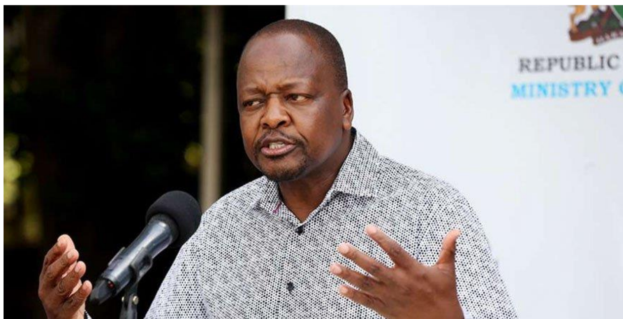
ภาพของ นาย Mutahi Kagwe รัฐมนตรีสาธารณสุขเคนยา

กระทรวงสาธารณสุขเคนยาได้ออกประกาศแก้ไขระเบียบการยื่นขอใบรับรองด้านสาธารณสุข ที่มีอัตรา 1,000 เคนยาชิลิ่งต่อครั้ง (Shipment) ในการส่งออก และนำเข้า สินค้าประเภท ชา กาแฟ สมุนไพร และเครื่องเทศ (tea, coffee, herbs exports and imports of food spices) เมื่อวันที่ 20 พ.ค. 63 โดยมาตรการดังกล่าว เพื่อลดต้นทุนของผู้ส่งออกสินค้าและนำเข้าสินค้าดังกล่าว ซึ่งเป็นการยกเลิกการขอใบรับรองดังกล่าวที่มีมาตั้งแต่ปี 2001 โดยเอกสารดังกล่าว เป็นใบรับรองที่ใช้ในการรับรองมาตรฐานสินค้าตามประกาศของกระทรวงสำหรับสินค้าอาหารจากประเทศผู้ผลิตว่ามีมาตรฐานตามที่กระทรวงสาธารณสุขเคนยารับรอง