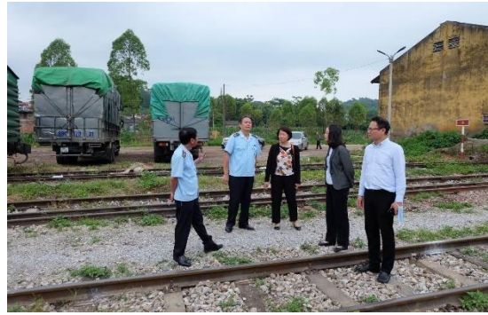
จุดขนถ่ายสินค้าใกล้กับสถานีรถไฟ

- กระบวนการขนถ่ายสินค้า สามารถทำได้ ๒ รูปแบบ คือ