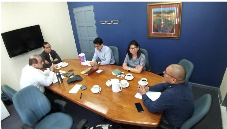
ขณะร่วมประชุม