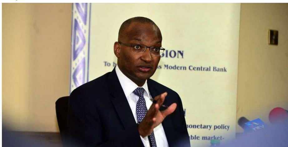
นาย Patrick Njoroge ผู้ว่าการธนาคารกลางเคนยา Central Bank of Kenya (CBK) แถลงข่าวกับสื่อมวลชนเคนยาและต่างประเทศ

การลดอัตราดอกเบี้ยดังกล่าว ทำให้ดอกเบี้ยนโยบายของเคนยามีระดับต่ำที่สุดในรอบ 3 ปีที่ผ่านมา สะท้อนให้เห็นว่า ภาคธุรกิจในเคนยาประสบปัญหาสภาพคล่องและต้องการความช่วยเหลือจากรัฐบาลเพื่อประคองธุรกิจในระหว่างที่ยังมีการระบาดของ COVID 19 ที่ทำให้ประเทศเคนยาและทั่วโลกอยู่ในสภาวะที่เศรษฐกิจจะเข้าสู่ภาวะตกต่ำทั่วโลก โดยจากสถานการณ์ล่าสุด ธนาคารกลางเคนยาได้ยอมรับว่า เศรษฐกิจเคนยาอาจขยายตัวแค่ร้อยละ 3.4 ในปี 2020 จากเดิมที่คาดว่าจะขยายตัวถึงร้อยละ 6.4 ก่อนเกิดสถานการณ์การระบาดของ COVID 19 โดยปัจจุบันเคนยาพบผู้ติดเชื้อ COVID 19 แล้ว 25 คน (ตัวเลข ณ วันที่ 24 มีนาคม)