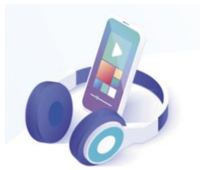
Subscription-based media such as news, magazines, streaming of TV shows and music, and online gaming