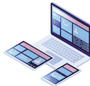
Software programs such as photoshop tools, anti-virus software and office suites