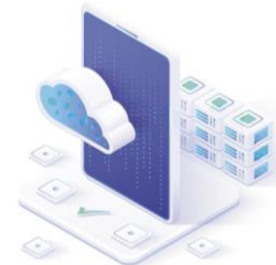
Electronic data management such as website hosting and cloud storage services