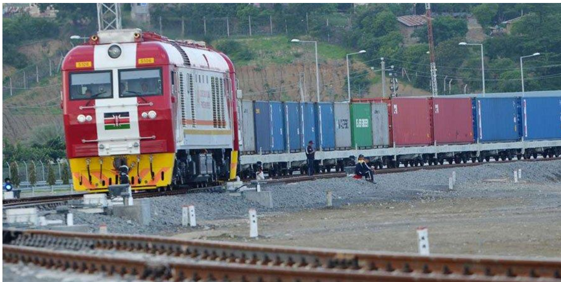
ภาพการขนส่งทางรถไฟสาย SGR จากเมืองท่า Mombasa ไป กรุงไนโรบี ของเคนยา ที่รัฐบาลให้เงินกู้แก่เคนยาในการพัฒนา และเป็นการขนส่งหลักของสินค้านำเข้าในปัจจุบัน

จากการศึกษา ได้พบว่า การขนส่งสินค้าโดยเฉพาะสินค้านำเข้าผ่านระบบรถไฟสาย SGR หรือ เส้นทางเมืองท่า Mombasa และกรุงไนโรบี ได้เพิ่มขึ้นจากช่วงเดียวกันของปีก่อนถึงร้อยละ 79 ในช่วงเดือน ม.ค.-ก.ย. 2019 แต่ข้อมูลการเพิ่มขึ้นนี้ ได้เปิดเผยหลังจากกระแสการเรียกร้องของผู้นำเข้าที่กล่าวหาว่า การบังคับของรัฐบาลเคนยาให้ผู้นำเข้าขนส่งสินค้าทางรถไฟแทนทางถนนส่งผลให้ต้นทุนการนำเข้าสินค้าของเขาเพิ่มขึ้นถึงร้อยละ 50 ทั้งค่าธรรมเนียมรถไฟที่ถูกเรียกเก็บ และขั้นตอนพิธีศุลกากรที่ยุ่งยากจากสถานีไปยังศูนย์กระจายสินค้า ตลอดจนค่าใช้จ่ายที่ต้องเสียค่าขนส่งสินค้าทางรถยนต์จากศูนย์กระจายสินค้าไปยังโกดังสินค้าของเขานั้น