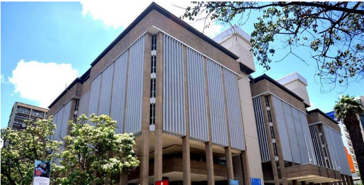
รูปภาพธนาคารกลางของเคนยา (Central Bank of Kenya (CBK)) ในกรุงไนโรบี

วันที่ 21 พฤศจิกายน 2562 ค่าเงินเคนยาซิลลิง (KES) เงินสกุลท้องถิ่นของเคนยาแข็งค่าขึ้นสูงสุดในรอบ 23 สัปดาห์โดยมาแข็งค่าจนล่าสุดยืนค่าได้ 101.30 เคนยาซิลลิงต่อ 1.00 USD ซึ่งธนาคารกลางเคนยากล่าวว่า การแข็งค่าเงินดังกล่าวนี้ มีการแข็งค่ามาเป็นลำดับในช่วง 5 วันที่ผ่านมา โดยการแข็งค่านี้ ผู้เชี่ยวชาญด้านการเงินของธนาคารแห่งแอฟริกา (Bank of Africa (BOA)) กล่าวว่า เกิดขึ้นเพราะว่ามีเม็ดเงินของเงินลงทุนจากต่างชาติเข้ามาลงทุนซื้อตราสารหนี้ระยะสั้นของรัฐบาลเคนยา