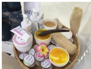
Superswiss GmbH (IATITAI)