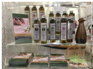
Samanee - Siam Naturprodukte & Massage