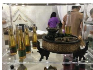
Ariya Spa Trade

7.2 ประเภทสินค้า : ผลิภัณฑ์เพื่อความงามและสินค้าสปาไทยจาก 8 บริษัท ได้แก่ น้ำมันนวด น้ำมันอโรมาสมุนไพรรไทยและดอกไม้ไทย ลูกประคบเกลือ ลูกประคบสมุนไพรร ผลิภัณฑ์บำรุงผิวหน้า ผิวกายและเท้า สครับขัดผิว สบู่เหลวและสบู่ก้อนจากสมุนไพรร ก้านไม้หอมและน้ำมันหอมระเหย และชาสมุนไพรรไทยต่าง ๆ