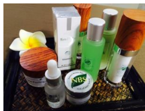
Natural Beauty Spa (NBS)