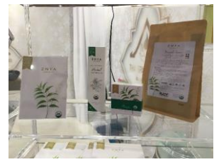
Blessed Products of Asia Co., Ltd. (Znya Organics)