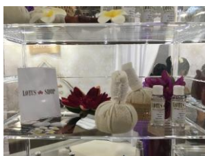
Lotus Shop Germany