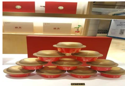
รังนกสำเร็จรูป ราคา 2,748 หยวน ต่อกล่อง (10 ถ้วย)

นอกจากนี้ พบว่ายังมีร้านค้าที่จำหน่ายรังนกโดยเฉพาะ เช่น ร้าน Yan'anju ซึ่งจำหน่ายรังนกและผลิตภัณฑ์รังนก (ทั้งรังนกแห้งและ รังนกสำเร็จรูป) มีสาขาทั่ว 400 สาขา ใน 27 มณฑล/เทียบเท่ามณฑล โดยในมณฑลฝูเจี้ยนมีร้านดังกล่าว 57 สาขา