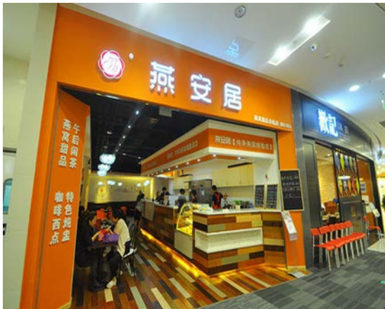
ภาพหน้าร้านรังนก Yan'anju

(1) ช่องทางออฟไลน์ เช่น ร้านค้าปลีก/ซูเปอร์มาร์เก็ตระดับพรีเมียม และร้านขายยา