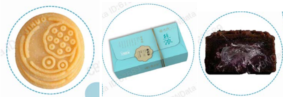
ขนมเปียะไส้รังนก

ตัวอย่างผลิตภัณฑ์อาหารที่มีส่วนผสมของรังนก