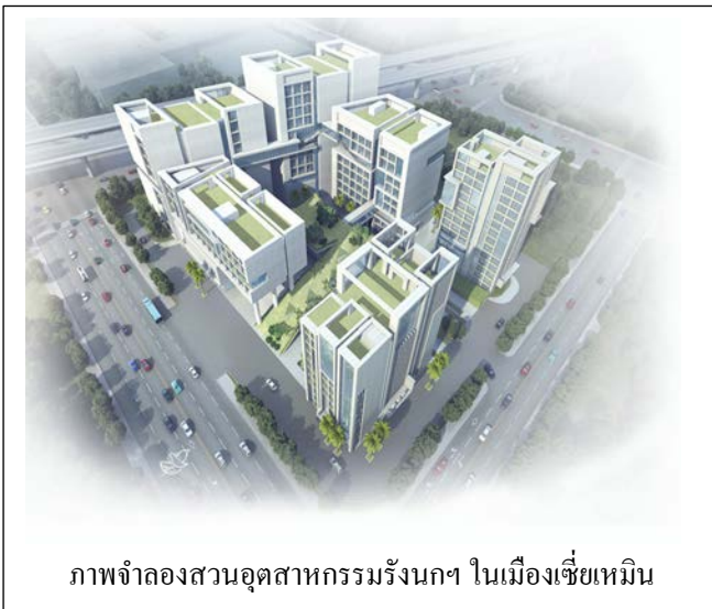
ภาพจำลองสวนอุตสาหกรรมรังนกฯ ในเมืองเซี่ยเหมิน

เพื่อรองรับความต้องการบริโภครังนก และเพื่อยกระดับคุณภาพมาตรฐานของรังนก บริษัท Southeast Edible Bird Nest Capital จำกัด จึงพัฒนาสวนอุตสาหกรรมรังนกตะวันออกเฉียงใต้ ซึ่งมีโรงงานตั้งอยู่ที่เมืองเซี่ยเหมิน โดยสวนอุตสาหกรรมฯ เป็นหนึ่งในโครงการก่อสร้างที่สำคัญของเมือง เซี่ยเหมิน มณฑลฝูเจี้ยน มีพื้นที่ก่อสร้างประมาณ 70,000 ตารางเมตร คาดว่าจะแล้วเสร็จภายในปี 2562 ทั้งนี้ สวนอุตสาหกรรมดังกล่าวจะเป็นจุดที่สำคัญที่ได้รวมห่วงโซ่อุปทานของ