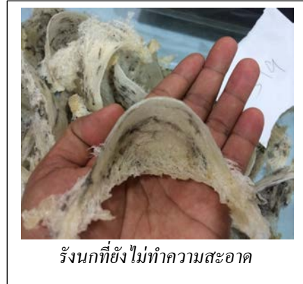
รังนกที่ยังไม่ทำความสะอาด

โดยเมื่อวันที่ 29 กรกฎาคม 2561 สุลกากรจีนได้ประกาศรายชื่อผู้ประกอบการจีนที่ได้รับอนุมัติให้แปรรูปรังนกดิบนำเข้าชุดแรก 2 ราย ได้แก่ บริษัท Guangxi Zhongma Qinzhou Industrial Park Jingu Investment จำกัด จากสวนอุตสาหกรรมชินโจว มณฑลกว่างซี กำลังการผลิตปีละ 15 ตันต่อปี และบริษัท Xiamen Free Trade Zone Xiamen Yan'anju Industrial จำกัด จากเขตทดลองการค้าเสรีเมืองเซี่ยเหมิน มณฑลฝูเจี้ยน กำลังการผลิต 250 ตันต่อปี