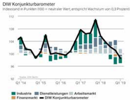
DIW Konjunkturbarometer 2 2019 DIW BERLIN

Wirtschaftsforschung (สถาบันเพื่อการวิจัยทางเศรษฐกิจประเทศเยอรมนี) ออกมาคาดการณ์ว่า ในช่วงไตรมาสแรกปี 2019 เศรษฐกิจของประเทศน่าจะมีการขยายตัวขึ้นร้อยละ 0.5 เลยทีเดียว