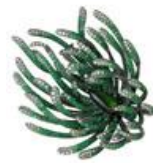
Goldiaq Creation Limited