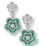
Schreiner Fine Jewellery