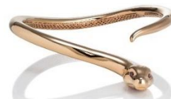
The Bright Falcon