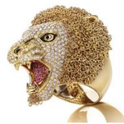
The Arabian Nights