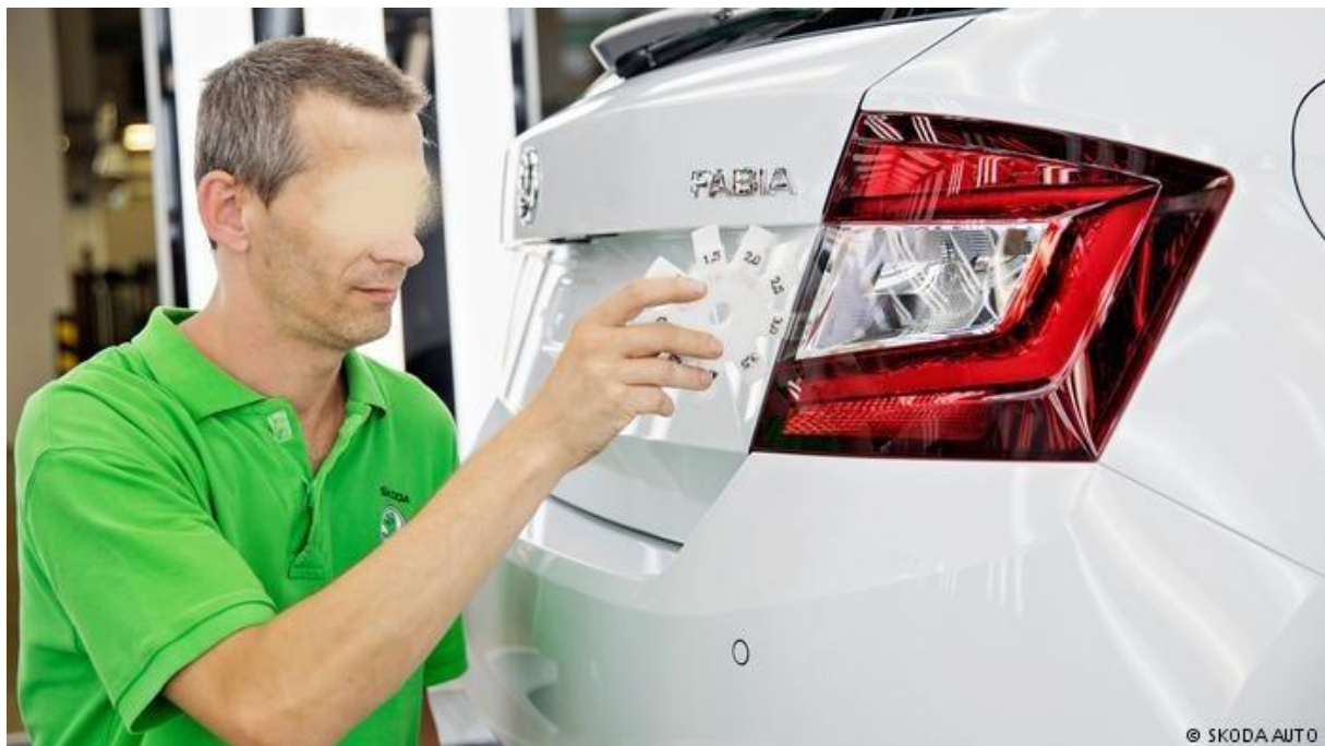
พนักงาน SKODA AUTO กำลังตรวจสอบรถยนต์รุ่น Fabia