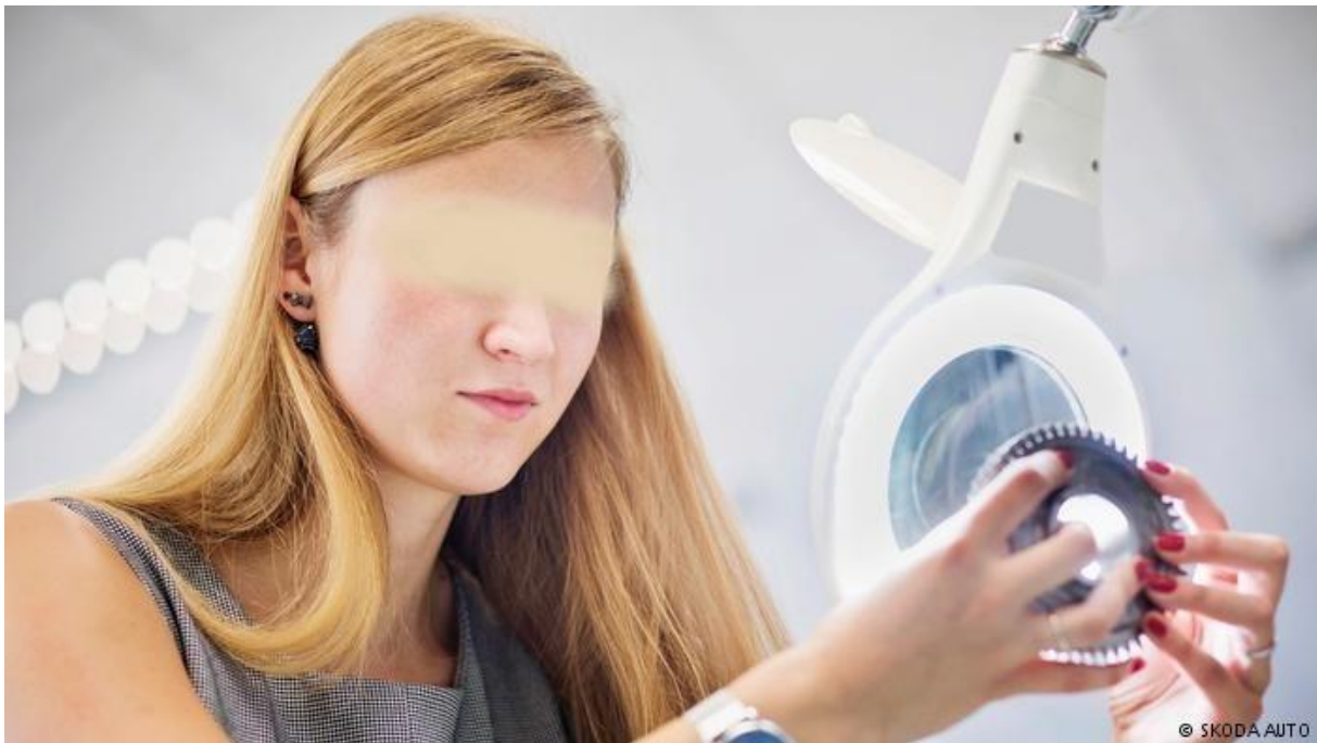
จากการสำรวจของสถาบัน Universum SKODA AUTO เป็นนายจ้างที่น่าดึงดูดใจที่สุดสำหรับนักศึกษาวิชาเทคนิคในสาธารณรัฐเช็ก

สามารถรับมือกับความท้าทายใหม่ๆ รวมถึงการเพิ่มขึ้นของหุ่นยนต์อัจฉริยะและปัญญาประดิษฐ์ (AI)