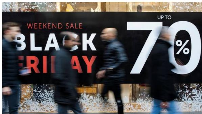
Spending at non-food retail shops through the country's electronic Paymark network was 54 per cent higher on November 23 than the Friday before.