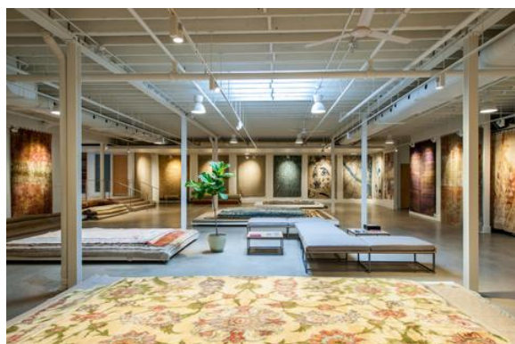
โชว์รูมของบริษัท Amala Carpet ในเมืองโทรอนโต

พรมทอมือระดับไฮเอน (100% Handmade Carpet) ที่ผลิตจากวัตถุดิบธรรมชาติ ไม่มีการใช้สารเคมีหรือเครื่องจักรในขั้นตอนการผลิตเพื่อรักษาระดับคุณภาพงานฝีมือระดับสูง