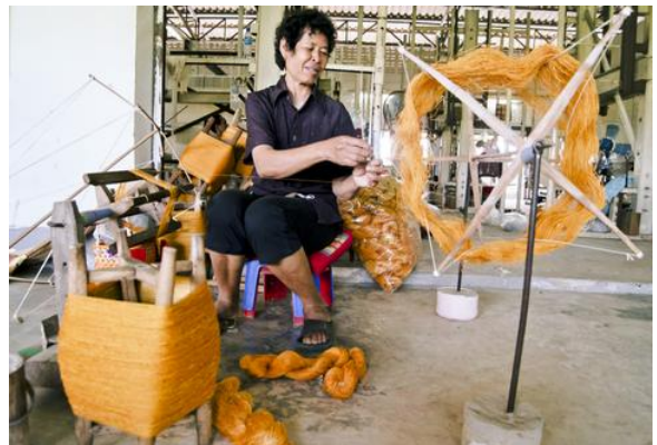
ขั้นตอนการผลิตพรมทอมือที่ไทย ที่ทุกขั้นตอนเป็นแรงงานฝีมือ 100% ที่เน้นใช้วัตถุดิบธรรมชาติที่เป็นออแกนิกส์