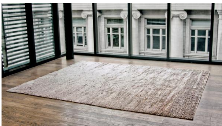
รูปแบบของพรม Area Rug ที่ใช้ตกแต่งห้องรับแขก