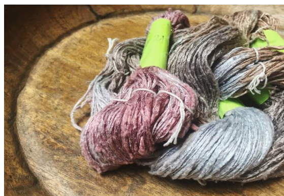
วัตถุดิบผ้าไหมจากไทยที่ทุกขั้นตอนการผลิตใช้แรงงานฝีมือ 100%