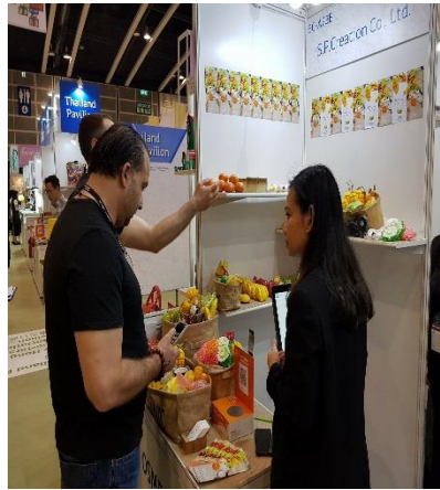
บ. S.P. Creation Co. Ltd. ผลิตภัณฑ์สบู่