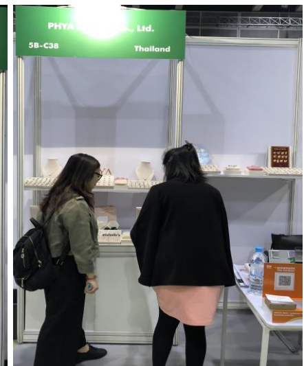
บ. PHYA Jewelry Co. Ltd. เครื่องประดับเงิน