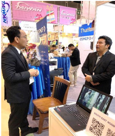
บริษัท South East Wood Co, Ltd. (สินค้าเฟอร์นิเจอร์และผลิตภัณฑ์ไม้)

คูหา Institute for Small and Medium Enterprise Development (SME. สสว)