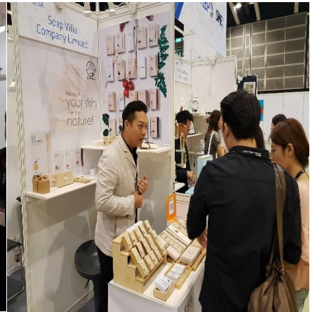
บ. Soap Villa Co. Ltd. Natural Skin care/Spa

โซน ผู้ประกอบการสมัครสภาอุตสาหกรรมแห่งประเทศไทย (F.T.I.)