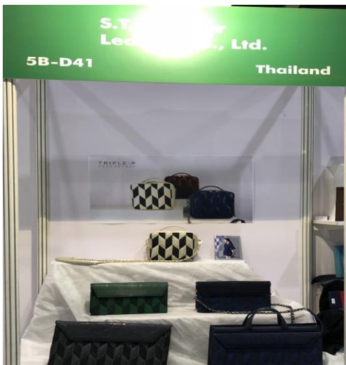
บริษัท S.T. Sea Star Leather Co Ltd. (เครื่องหนังและกระเป๋า)

โซน ผู้ประกอบการสมัครสภาอุตสาหกรรมแห่งประเทศไทย (F.T.I.)