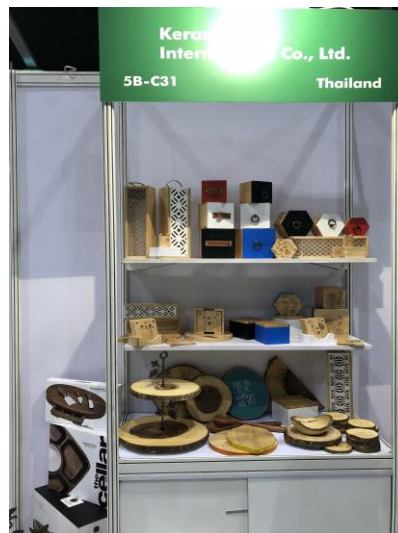
บ. Keramos Int'l Co.,Ltd. ผลิตภัณฑ์ไม้