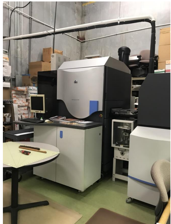
เครื่องพิมพ์ Wide Printing และเครื่องพิมพ์ Digital Printing