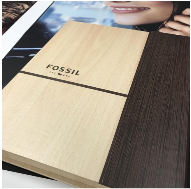
Pop-up แคตตาล็อกให้กับแบรนด์ Fossil