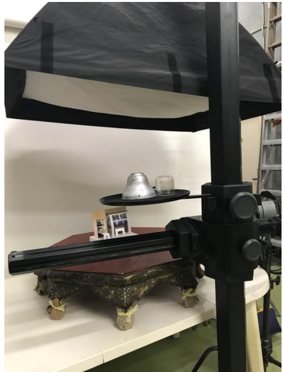
พื้นที่ทำงานของพนักงาน และพื้นที่ถ่ายรูป (Photography) เพื่อนำไปใส่ในสิ่งพิมพ์