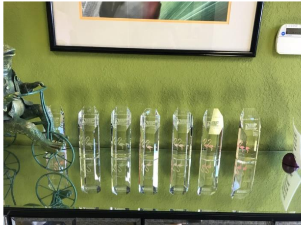
รางวัลที่บริษัทได้รับ