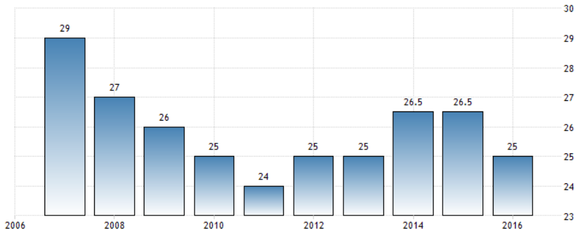
ISRAEL CORPORATE TAX RATE