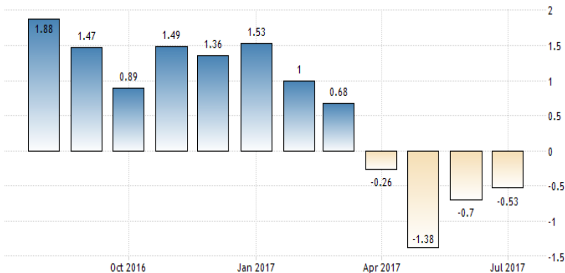
THAILAND FOOD INFLATION